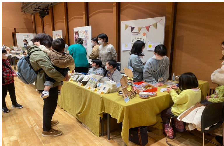
(柏崎のイベント出店、子供達が販売している様子です。)

○最後に、地域の皆さんには日頃から子供たちをあたたく見守っていただき感謝しています。本当にありがとうございます。