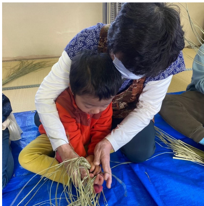
(石黒しめ縄づくり体験)